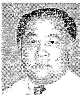
群馬大学医学部脳神経 外科 大江千広教授